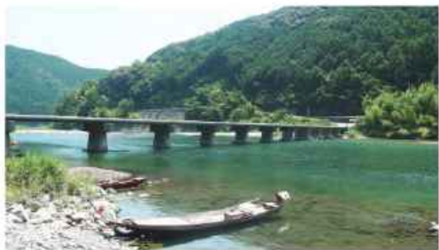
水質日本一 奇跡の清流仁淀川

答 【林業振興・環境部長】流域の皆様や関係団体等との対話、協議を進める中においては、新たな条例制定の必要性は見いだせなかった。清流仁淀川を守り後世に引き継いでいくために、県清流保全条例と仁淀川清流保全計画の枠組みの中で、取り組みを進めてまいります。