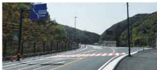
整備の加速化が進む国道494号佐川吾桑バイパス

【知事回答】 佐川吾桑バイパスの1.8km区間が令和2年度中に一部開通する予定ですが、まだまだ未改良区間が残っており、佐川吾桑バイパスや仁淀川町大西土居拡幅工区を重点に進める。