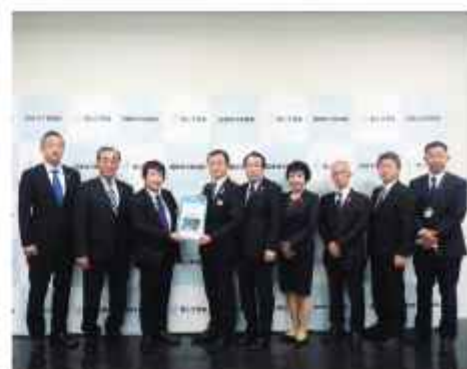
国道33号沿線首長と国交省への要望活動