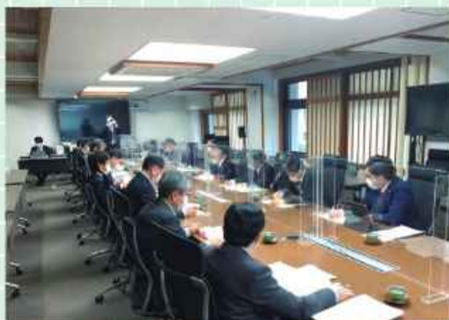
濱田知事と意見交換を行う県民の会