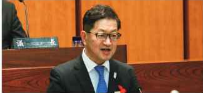
大野の質問に対して新型コロナから県民生活を 守り抜く決意を述べる濱田知事

答 【知事】飲食店などへの時間短縮営業の協力要請とあわせ、経済的なダメージを最小限に食い止めるため、要請協力店舗に協力金を支給する。