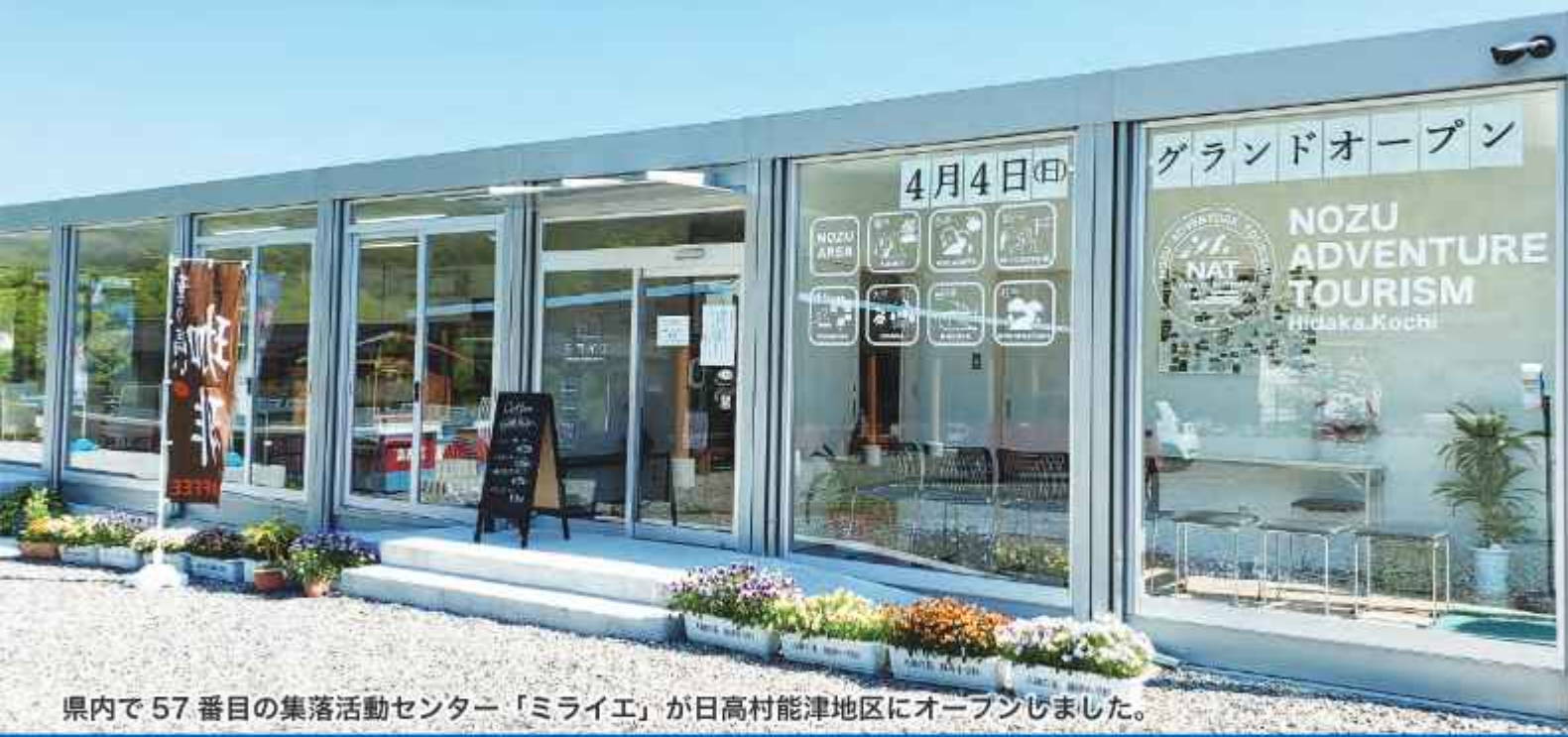
県内で57番目の集落活動センター「ミライエ」が日高村能津地区にオープンしました。