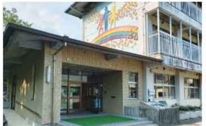
県立日高特別支援学校

答 【教育長】学校全体の施設の利用方法なども検討した上で、改修等に向けた調査や実施計画を進め、生活様式の変容や子供の利便性なども踏まえ対策を行ってまいりたい。