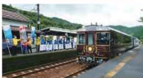
観光列車 志国土佐 時代の夜明けのものがたり