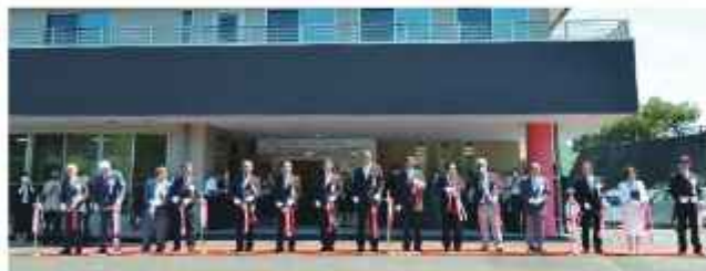
地域共生交流拠点ふらっとホームさかわ開所式

【大野】 訪問系や通所系の施設について、市町村の判断によって優先対象となり得るという改正があり安堵している。施設への速やかな情報提供と併せ、医師などが障害者施設に出向いて集団接種ができる体制について要請する。