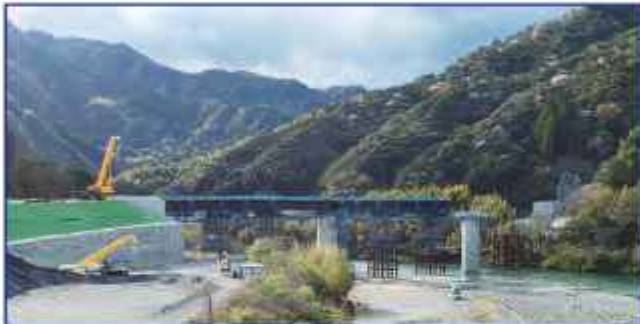
令和4年度の完成をめざして急ピッチで工事が進む 越知道路2工区（越知丙～丁、新今成トンネル間 1.8km）

答 【土木部長】地域の皆様に安心して道路を利用していただけるよう、整備促進に向け、沿線自治体の皆様と一体となって、引き続き、国への働きかけを行うなど全力で取り組む。