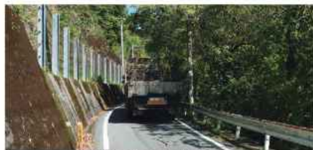
早期改良が望まれる県道18号

【知事回答】 落石など安全に通行することが難しい区間があり、越知町黒瀬から片岡区間2車線化の用地買収を進めている。令和3年度には黒瀬地区の道路拡幅工事とバイパスとなる区間のルート検討を行うよう予算を確保し事業を進めていく。