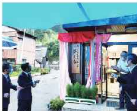
あったかふれあいセンター夢まち開所式