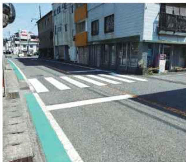
安全な交通環境をめざして

答 【県警本部長】 横断歩道など交通安全施設は、交通事故抑止に重要な役割を果たしている。定期的に点検し、計画的に随時補修を実施し、適正な交通安全施設の管理に努めるとともに、住民からの要望も踏まえ、関係機関と連携して交通環境の整備に努める。