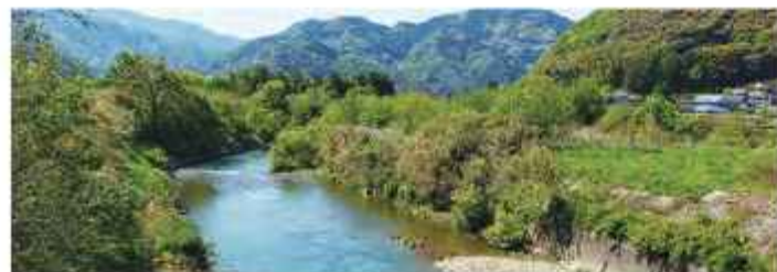
用地買収が進む柳瀬川改修事業

【知事回答】 地域住民の皆さまの熱い思いが詰まった事業であると受け止めており、下流工区の測量設計や用地調査を完了し、現在、用地買収に着手している。越知町、佐川町と協力・連携して早期改修に向け事業を推進していく。