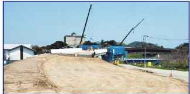
今秋に開通が予定される高知西バイパス 鎌田IC～波川（1.5km）